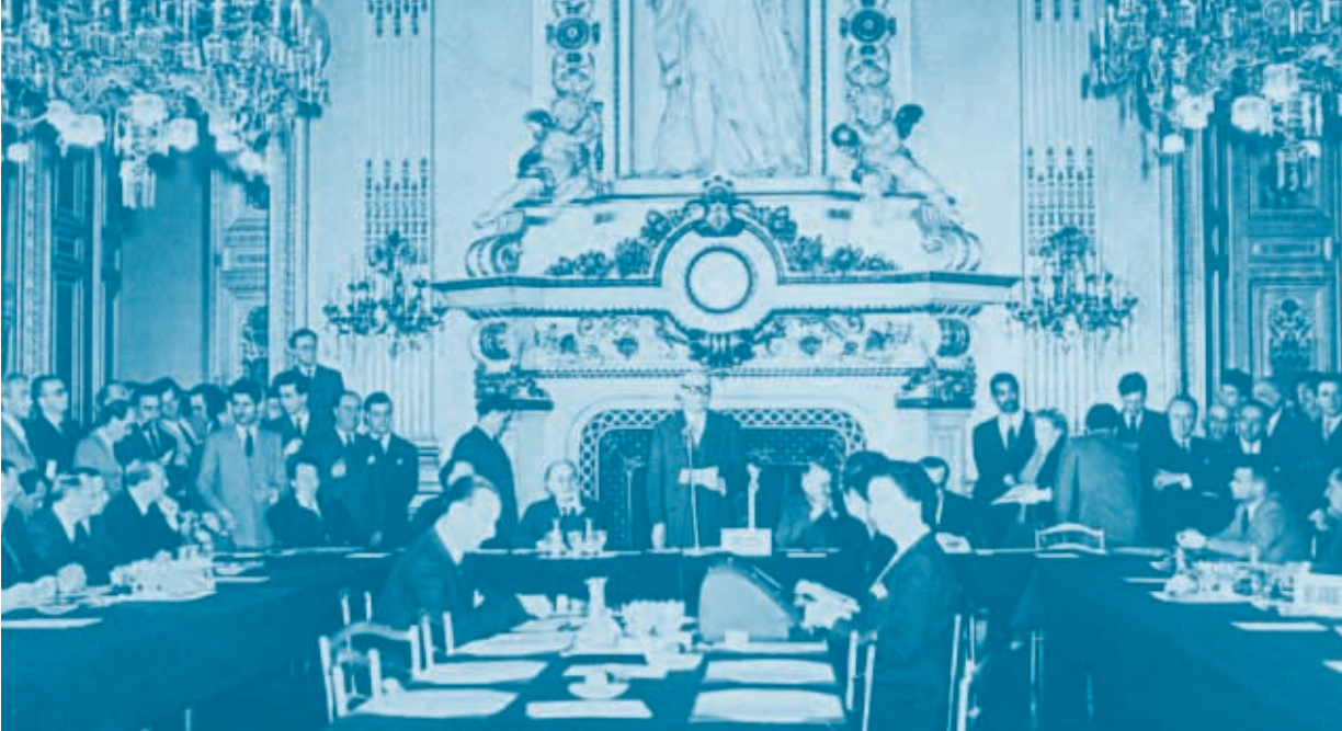
Εγκαινίαση του σχεδίου Schuman, 9 Μαΐου 1950: Σαλόνι του Ρολογιού, Υπουργείο Εξωτερικών της Γαλλίας. Στο μικρόφωνο ο Robert Schuman, δεξιά του ο Jean Monnet