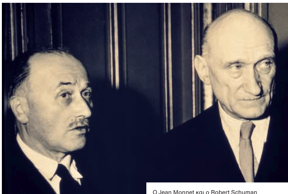
Ο Jean Monnet και ο Robert Schuman

προκαλούσαν το φόβο ότι οι παραγωγοί, πιστοί στις παραδόσεις των αρχισιδηρουργών του μεσοπολέμου, θα διαμόρφωναν πάλι μια συντεχνία προκειμένου να μειώσουν τον ανταγωνισμό. Όντας σε πλήρη φάση ανασυγκρότησης, οι ευρωπαϊκές οικονομίες δεν μπορούσαν να επιτρέψουν την παράδοση των βασικών βιομηχανιών τους στην κερδοσκοπία ή στην οργανωμένη ανεπάρκεια προϊόντων.