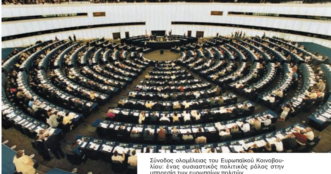
Σύνοδος ολομέλειας του Ευρωπαϊκού Κοινοβουλίου: ένας ουσιαστικός πολιτικός ρόλος στην υπηρεσία των ευρωπαίων πολιτών

Μια Ένωση η οποία μέχρι το τέλος της δεκαετίας θα περιλαμβάνει 25 κράτη μέλη, και αργότερα θα φτάσει τα 30 ή τα 35 κράτη μέλη, θα μπορεί να λειτουργήσει με θεσμικά όργανα τα οποία δημιουργήθηκαν το 1950 για έξι κράτη;