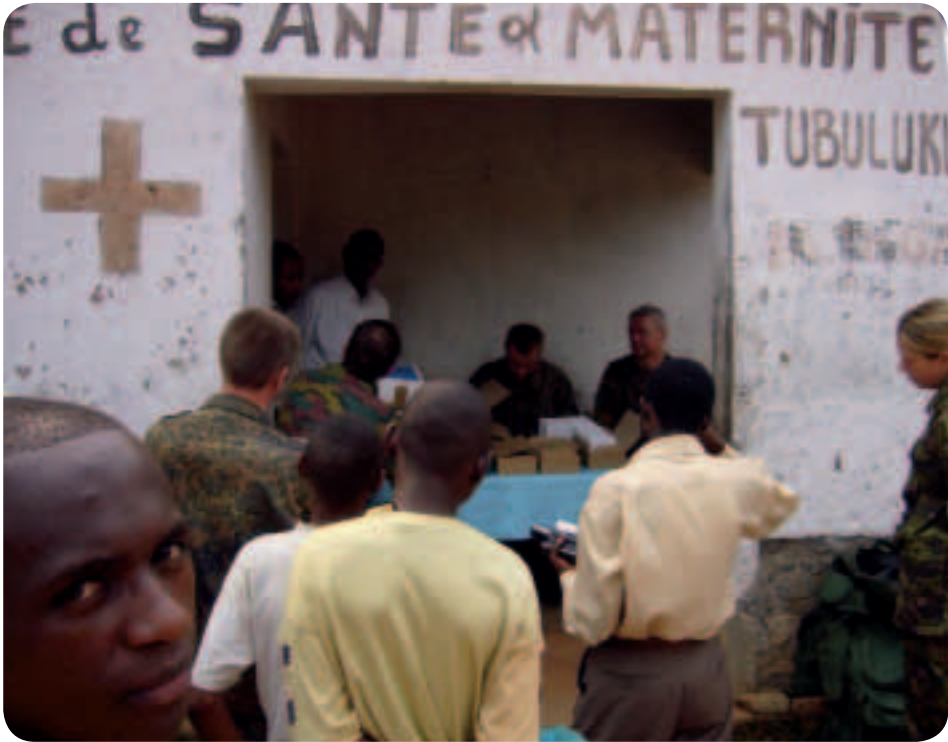
Προσφορά βοήθειας στις δύσκολες στιγμές — οι στρατιώτες της ΕΕ συμβάλλουν στην αποκατάσταση της ειρήνης στο Κονγκό

να δικαιώματα υπερβαίνει τα όρια των παραδοσιακών αμυντικών συμμαχιών.