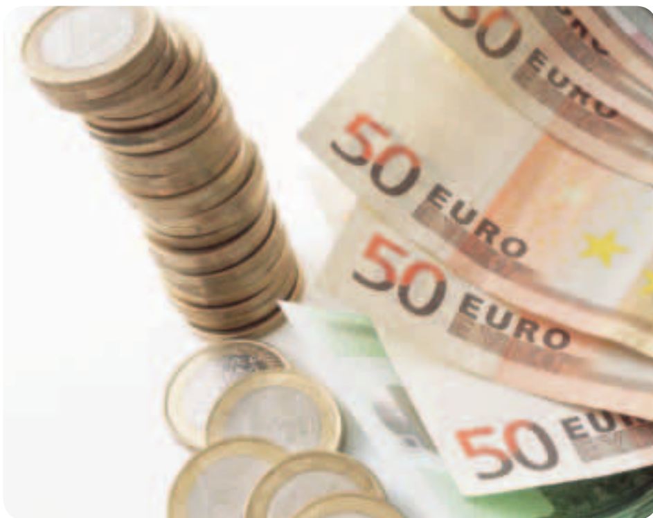
Το ευρώ: το ενιαίο νόμισμα για πάνω από 310 εκατομμύρια πολίτες της ΕΕ

Τα νέα κράτη μέλη της ΕΕ αναμένεται να υιοθετήσουν το ευρώ όταν θα πληρούν τις απαραίτητες προϋποθέσεις. Η Σλοβενία ήταν η πρώτη από τις χώρες της διεύρυνσης του 2004 που πληρούσε τις προϋποθέσεις αυτές και μπήκε στην ευρωζώνη την 1η Ιανουαρίου 2007.