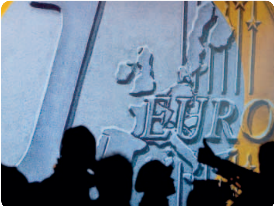
Ένα νέο νόμισμα γεννήθηκε το 1999 όταν κυκλοφόρησε το ευρώ για χρηματικές συναλλαγές (όχι τοις μετρητοίς). Χαρτονομίσματα και κέρματα τέθηκαν στην κυκλοφορία το 2002.