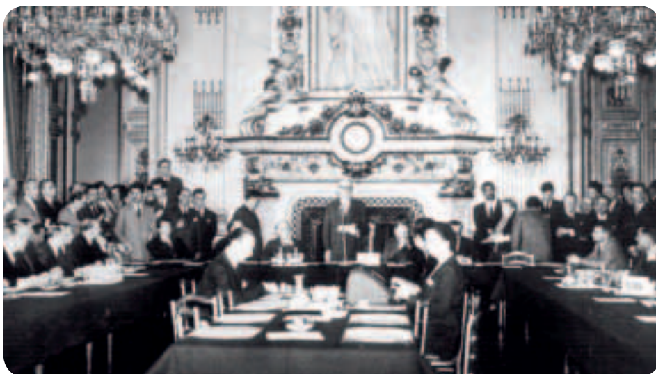
Στις 9 Μαΐου 1950, ο γάλλος υπουργός εξωτερικών Ρομπέρ Σουμάν διακήρυξε για πρώτη φορά δημοσίως τις ιδέες που οδήγησαν στην Ευρωπαϊκή Ένωση. Έτσι, η 9η Μαΐου εορτάζεται ως η ημερομηνία γέννησης της ΕΕ

γο και Κάτω Χώρες). Στόχος, μετά το τέλος του Β΄ Παγκοσμίου Πολέμου, ήταν η διασφάλιση της ειρήνης ανάμεσα σε νικητές και ηττημένους και η συμφιλίωση των χωρών επί ίσοις όροις με τη συνεργασία τους μέσα σε ένα κοινό θεσμικό πλαίσιο.