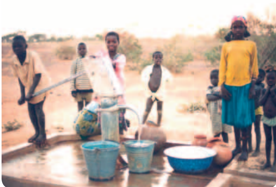
Μια από τις προτεραιότητες της ΕΕ είναι η εξασφάλιση καθαρού νερού για όλους

Η ΕΕ παρείχε στις χώρες της Μεσογείου χρηματοδοτική ενίσχυση ύψους 5,3 δισ. EUR κατά την περίοδο 2000–2006. Τη δημοσιονομική περίοδο 2007–2013, ένα ευρωπαϊκό μέσο γειτονίας και εταιρικής σχέσης (EMΓΕΣ) ακολουθεί και συγχωνεύει το μέχρι πρότινος ανεξάρτητο πρόγραμμα ενίσχυσης για τις χώρες της Μεσογείου και τους άλλους γείτονές της ανάμεσα στα διάδοχα κράτη της πρώην Σοβιετικής Ένωσης.