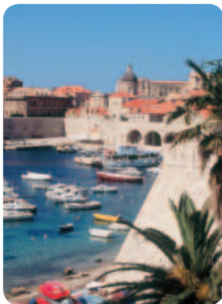
Το «Μαργαριτάρι της Αδριατικής», το Ντουμπρόβνικ στην Κροατία

Οι δημόσιες συζητήσεις σχετικά με την επικύρωση της συνταγματικής συνθήκης της ΕΕ που πραγματοποιήθηκαν στα περισσότερα κράτη μέλη έδειξαν ότι πολλοί Ευρωπαίοι είχαν κάποιες ανησυχίες για