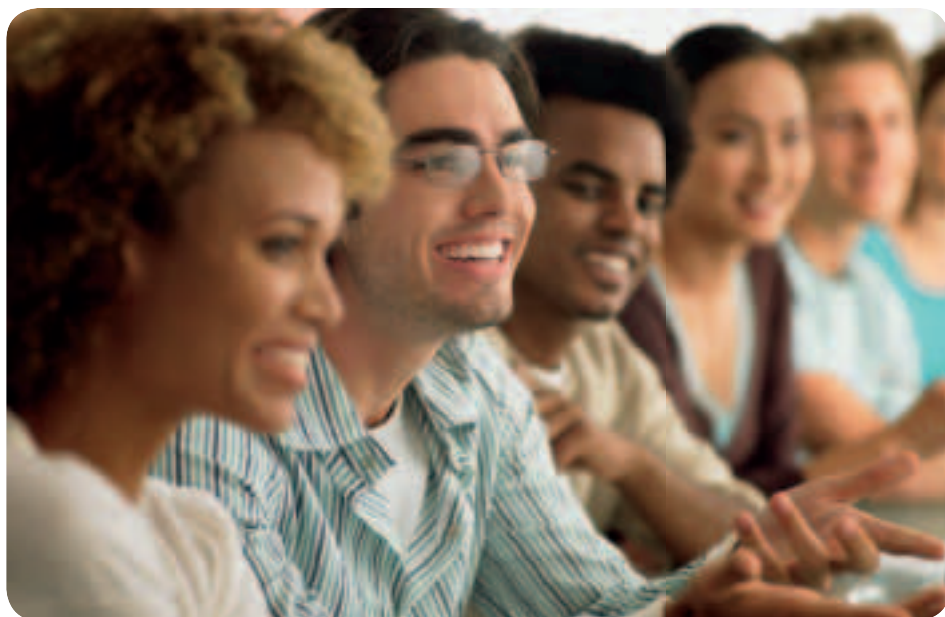
Ευρώπη — μια αγορά ιδεών

Όποιο συνταγματικό καθεστώς και να επιλέξουν τελικά τα κράτη μέλη της ΕΕ στο πλαίσιο νέων διαπραγματεύσεων, θα πρέπει να επικυρωθεί από καθένα από αυτά είτε στο κοινοβούλιο είτε με εθνικό δημοψήφισμα. Για να διευκολύνει τη δημόσια συζήτηση, η Ευρωπαϊκή Επιτροπή ανέλαβε πρωτοβουλία ενημέρωσης των πολιτών μέσω του «Προγράμματος Δ για τη δημοκρατία, το διάλογο και τη δημόσια συζήτηση».