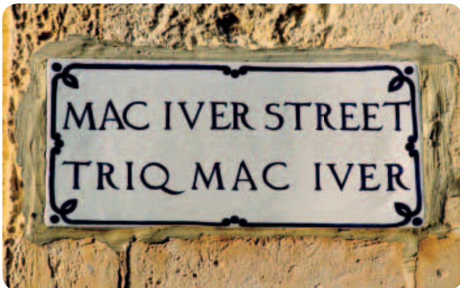
Ενωμένοι στην πολυμορφία — μια δίγλωσση πινακίδα στη Μάλτα