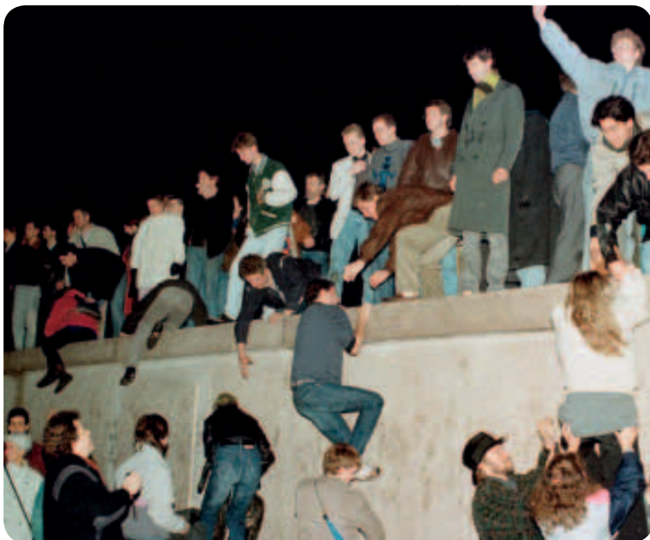
Το Τείχος του Βερολίνου έπεσε το 1989 και οι παλαιότερες διαιρέσεις εντός της ευρωπαϊκής ηπείρου σταδιακά εξαφανίστηκαν

6. Η παγκόσμια οικονομική ύφεση στις αρχές της δεκαετίας του 1980 δημιούργησε ένα κλίμα «ευρωσκεπτικισμού». Όμως, οι ελπίδες αναζωπυρώθηκαν το 1985 όταν η Ευρωπαϊκή Επιτροπή, με πρόεδρο τον Ζακ Ντελόρ, δημοσίευσε μια λευκή βίβλο που περιλάμβανε ένα χρονοδιάγραμμα για την ολοκλήρωση της ενιαίας ευρωπαϊκής αγοράς μέχρι την 1η Ιανουαρίου 1993. Αυτός ο φιλόδοξος στόχος διατυπώθηκε στην Ενιαία Ευρωπαϊκή Πράξη που υπογράφηκε τον Φεβρουάριο του 1986 και τέθηκε σε ισχύ την 1η Ιουλίου 1987.