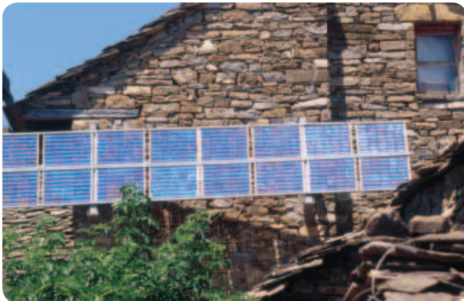
Η αξιοποίηση των φυσικών πόρων του πλανήτη είναι ένας τρόπος καταπολέμησης των κλιματικών αλλαγών

νάλωση ενέργειας μπορεί να μειωθεί κατά ένα πέμπτο έως το 2020 αν οι καταναλωτές αλλάξουν τις συνήθειές τους και αν εκμεταλλευτούμε στο έπακρο τις τεχνολογίες που μπορούν να βελτιώσουν την εξοικονόμηση ενέργειας.