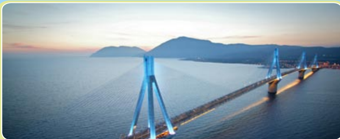
Σύνδεση των περιφερειών, τόνωση της οικονομίας

Το έργο αυτό, που υποστηρίχθηκε από το Ταμείο Συνοχής με περίπου €10 εκατ. (το συνολικό κόστος του ανήλθε στα €13 εκατ.), έδωσε τη δυνατότητα να κατασκευαστεί ένας χώρος υγειονομικής ταφής για τα στερεά απόβλητα της περιοχής (δύο μονάδες) και να αναπτυχθεί ένα περιφερειακό δίκτυο για τη μεταφορά των στερεών αποβλήτων. Συνεπώς το έργο δεν συμβάλλει μόνο στην προστασία του άμεσου περιβάλλοντος, αλλά εξυπηρετεί και τις ανάγκες του τοπικού πληθυσμού.