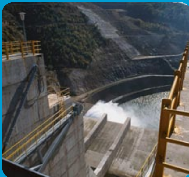
Το φράγμα Θησαυρού, στα σύνορα με τη Βουλγαρία, καλύπτει αρδευτικές και ενεργειακές ανάγκες

Επίσης η Ελλάδα έλαβε βοήθεια από το Ταμείο Αλληλεγγύης της Ευρωπαϊκής Ένωσης μετά τις δασικές πυρκαγιές που προκάλεσαν μεγάλες καταστροφές σε πολλές περιοχές της χώρας το καλοκαίρι του 2007. Οι ζημιές υπολογίστηκαν σε πάνω από €2 δισ. Στην Ελλάδα χορηγήθηκαν συνολικά €90 εκατ. ως βοήθεια για τη συμβολή στην ανοικοδόμηση των περιοχών που επλήγησαν.